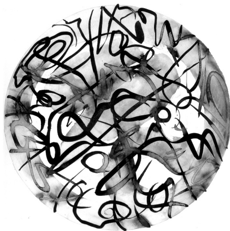
Labirinto 1986 inchiostro 35x50 cm